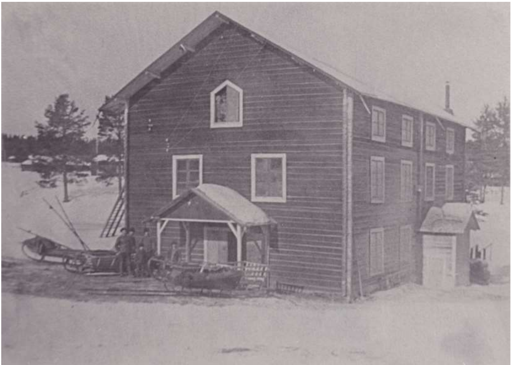
Gyljens kvarn 1915.